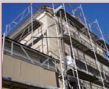
Sicurezza e D.Lgs 106/09