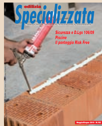
Nella foto di copertina: applicazione della schiuma poliuretamica Sitol Schiumapur Block di Toggler Chimica.

Emanuele, Gaetano e Gisella Bertini Malgarini