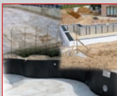
Un tuffo nella tecnologia